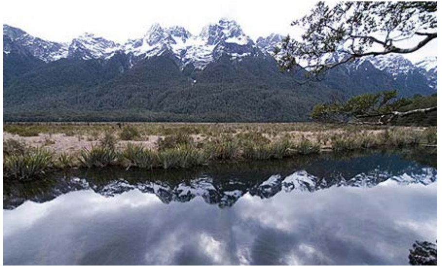
dawn วิวสวยเหมือนกัน แวะ Mirror lake ด้วย ล่องเรือใน Milford Sound แวะชมน้ำตกในขณะล่องเรือ